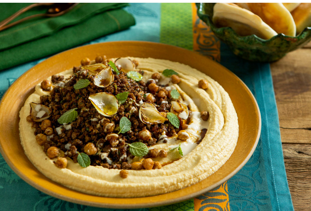
Homus com cordeiro (Hummus ma lahma)