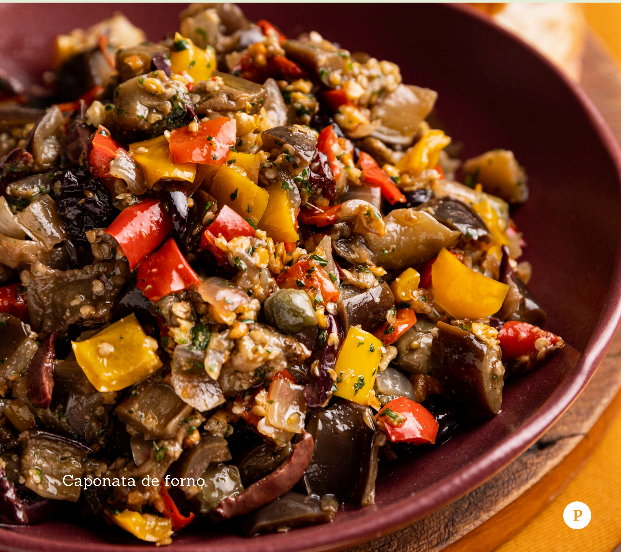
Caponata de forno