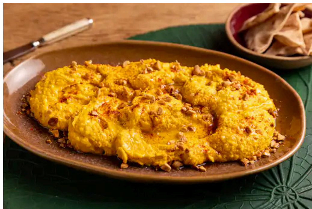
Homus de cenoura assada na Air Fryer da Rita Lobo