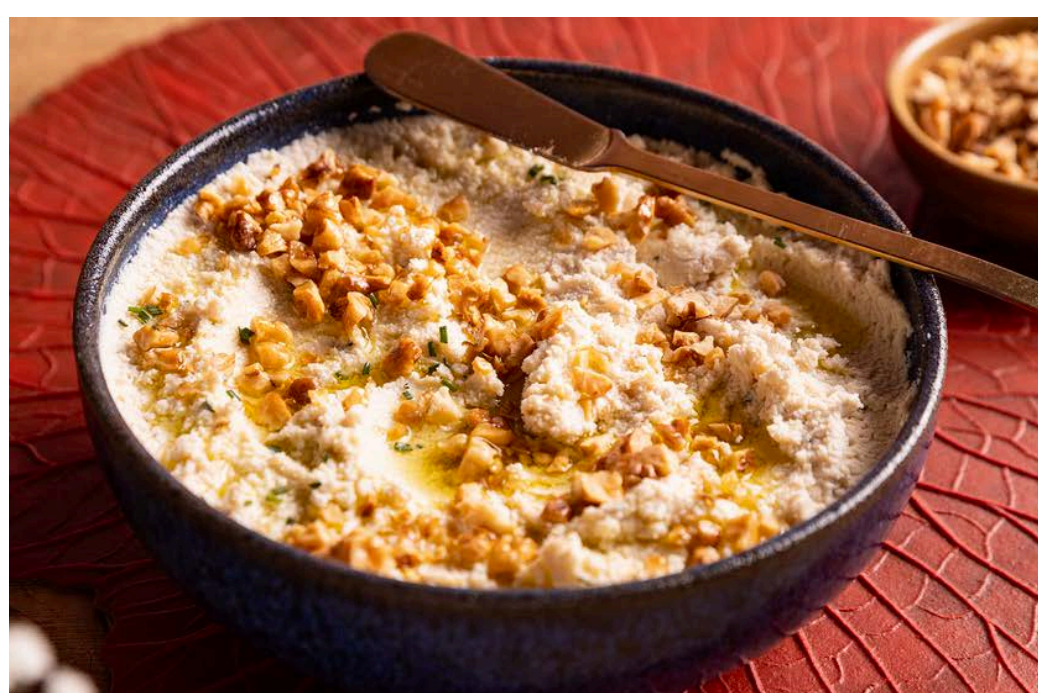
Pastinha de ricota com melado e alecrim