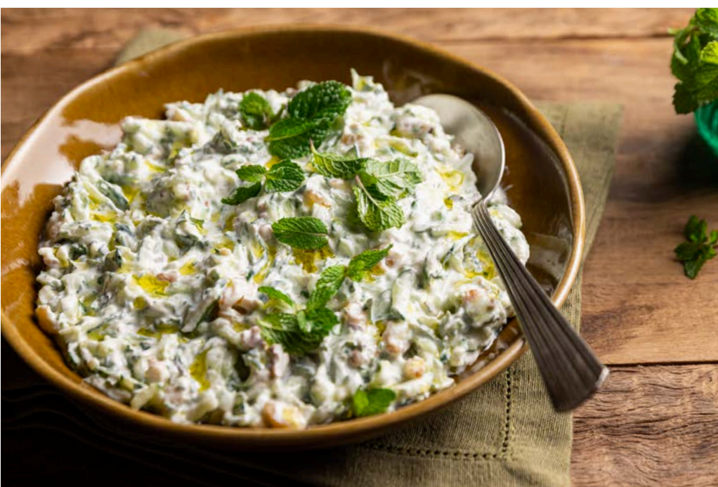
Salada de pepino com uva-passa