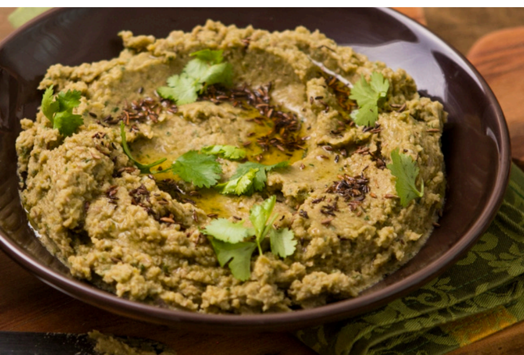
Pasta de ervilha e lentilha com cominho