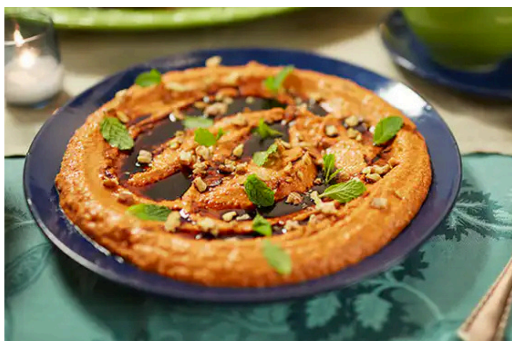
Pasta de pimentão vermelho (muhammara)