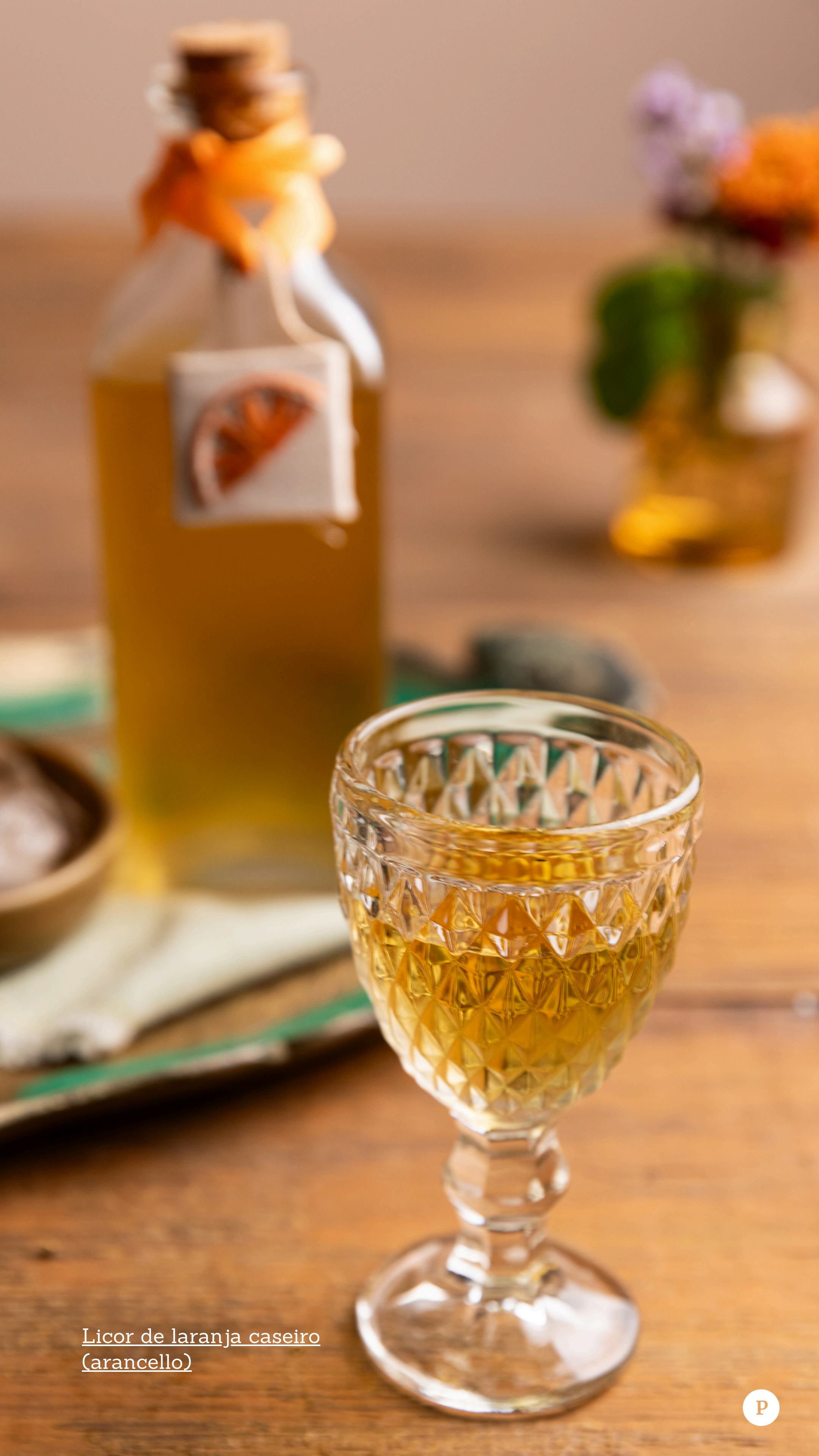
Licor de laranja caseiro (arancello)