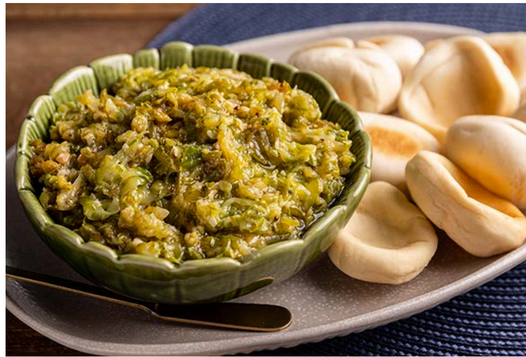
Antepasto de abobrinha