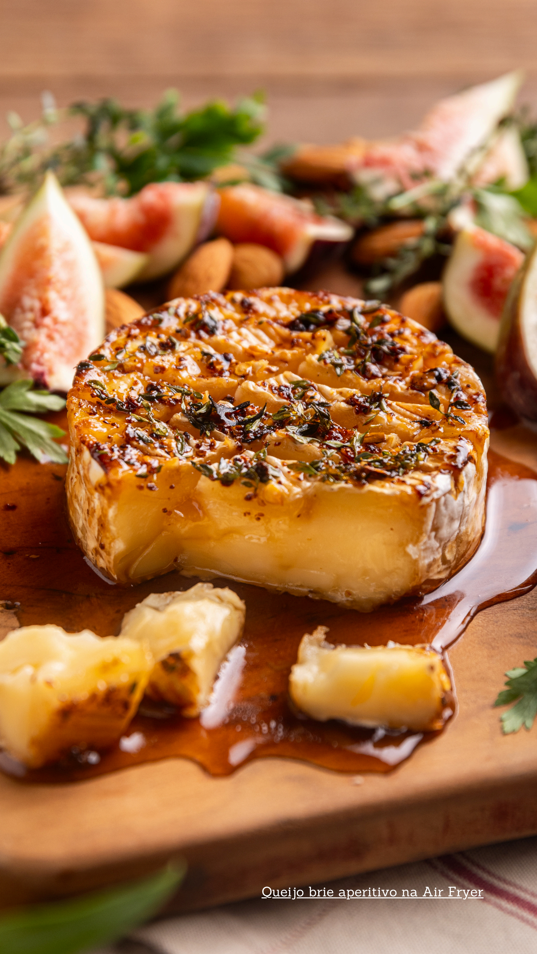
Queijo brie aperitivo na Air Fryer